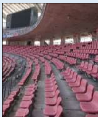
あっち向きなら走れる

この観客席はよく見ると一定方向には走りやすいことが判明しました。 なので、新しい地図記号「特定方向に走りやすいスタンド」を勝手に作りました。