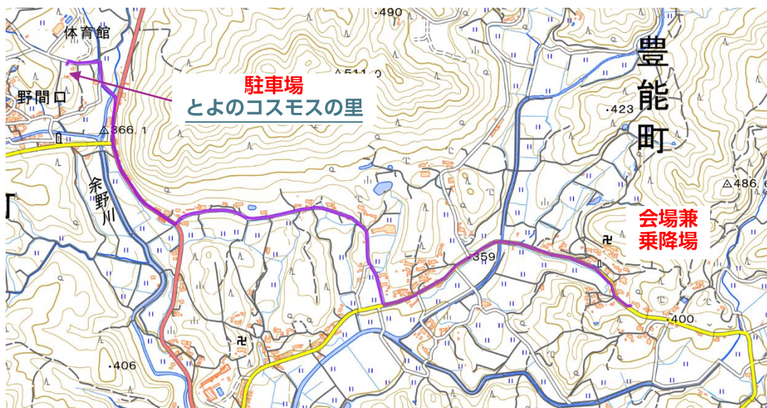
day1 駐車場から会場の徒歩経路図（国土地理院「地理院地図」を加工して作成）

※会場の駐車可能台数が少ないため、会場から徒歩35分程度の「とよのコスモスの里」駐車場への駐車をお願いいたします。申込人数によっては、会場の駐車場を案内する場合があります。