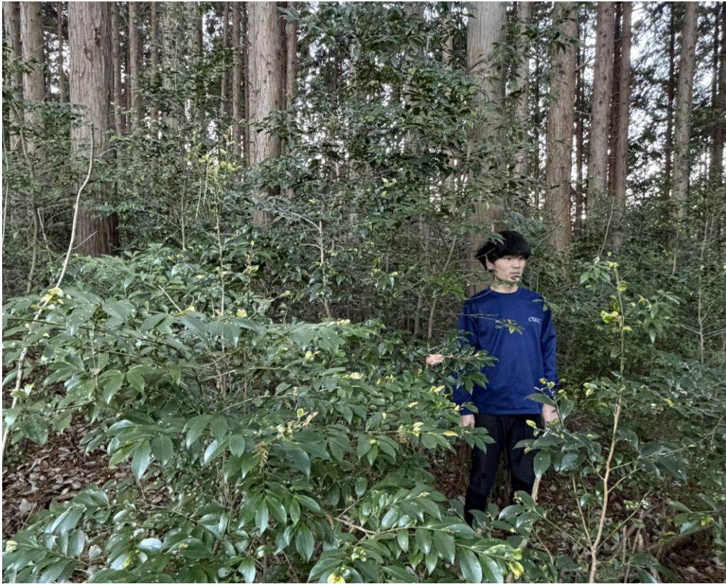
408 藪(走行困難) Vegetation, walk