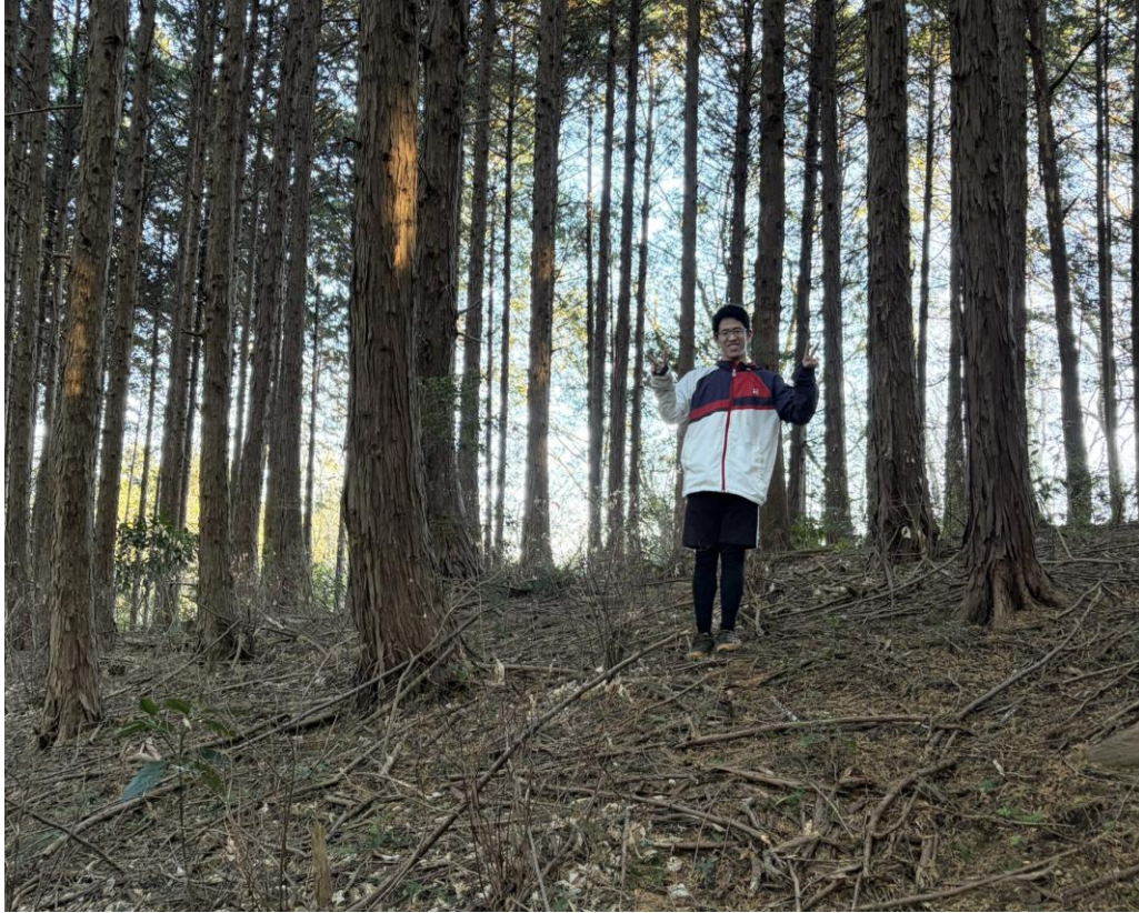
405 森 Forest