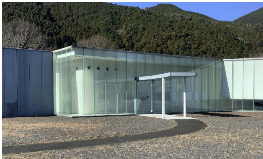
熊野古道なかへち美術館

大会当日、降雪など悪天候が予想される場合は、1月18日午前6時30分までに、 Japan-O-entrYの大会ページ 、および、 和歌山県オリエンテーリング協会公式X(旧twitter) でお知らせします。 公式ウェブサイトには、掲載いたしません。