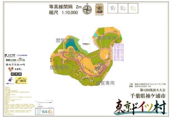
第42回筑波大会 東京ドイツ村 午後競技「企画部練」より引用