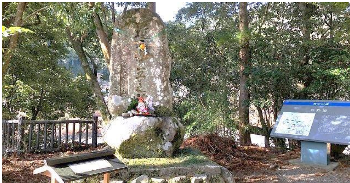
熊野古道近露王子