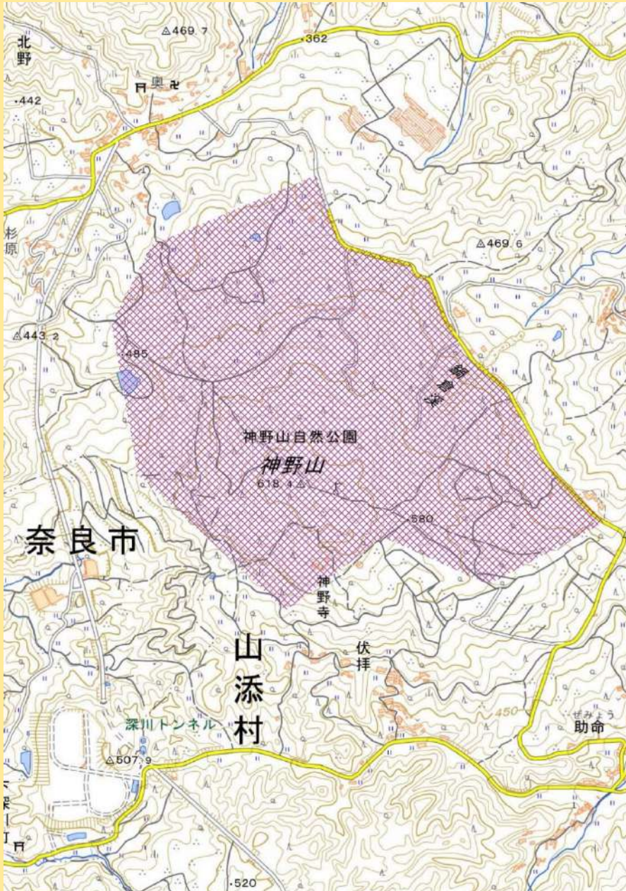
(地理院地図を加工して作成)