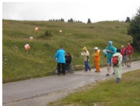
トレイルOの競技風景

フラッグは、コントロール付近にある DP (Decision Point) から見て、左から A、B、C、D、E となります。DP から離れた位置から見ると、フラッグの位置関係が変わる場合があるので、注意が必要です。