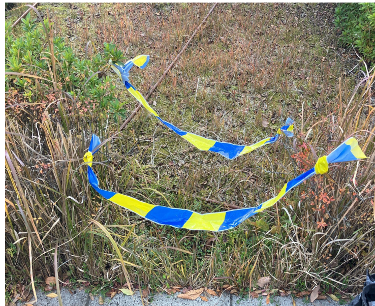
青黄テープの使用例