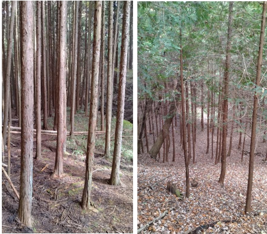
405：森 典型的な走りやすい林