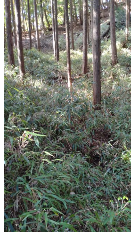
407 : 植生 (速度低下、見通し良好)