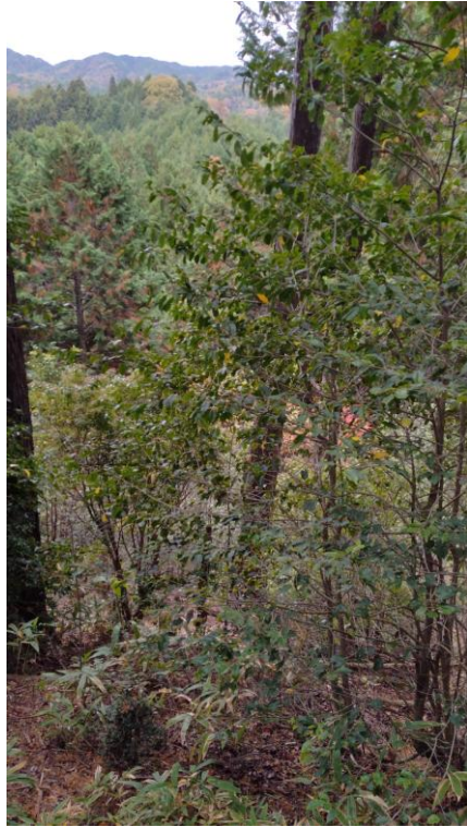
408 : 植生 (走行困難)