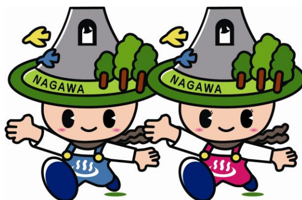
長和町イメージキャラクター・なっちゃん