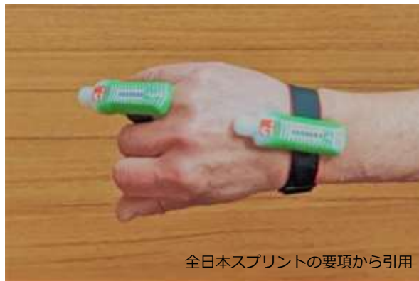
全日本スプリントの要項から引用

クリア、チェック、テストを忘れずに行ってください。バックアップ用 SIAC は配布物置き場にありますので、各自で自由にお取りください。