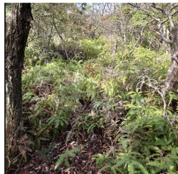
通れるもののスピードは落ちる