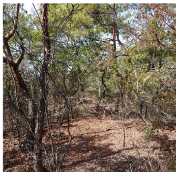
スピードを上げての通過は困難