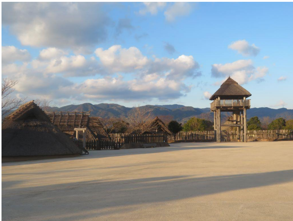
吉野ヶ里歴史公園