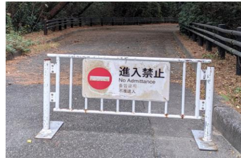
園内に存在する表示物の一例