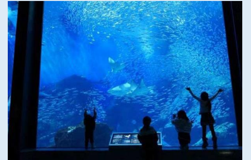
マリンワールド海の中道