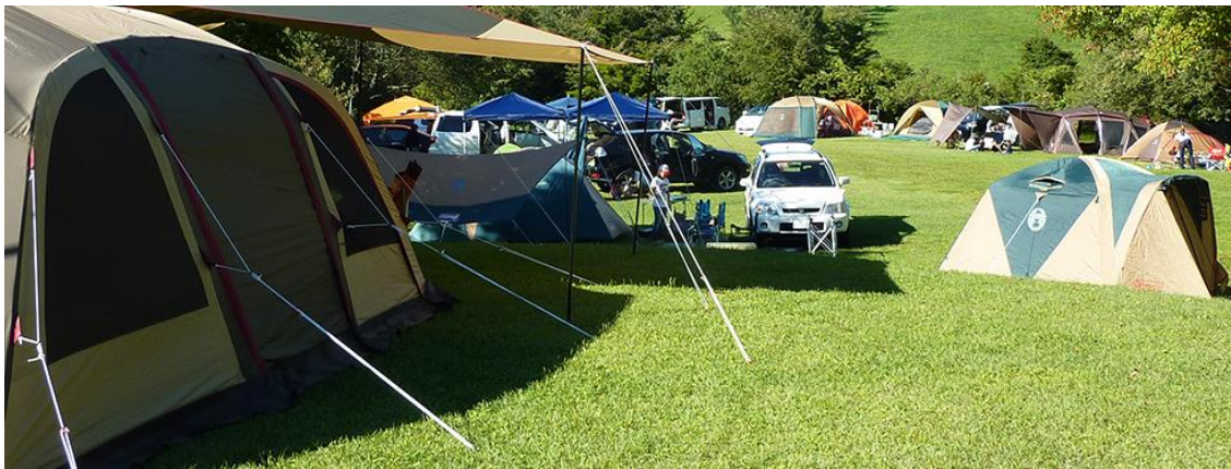
三河高原キャンプ村 HP より引用