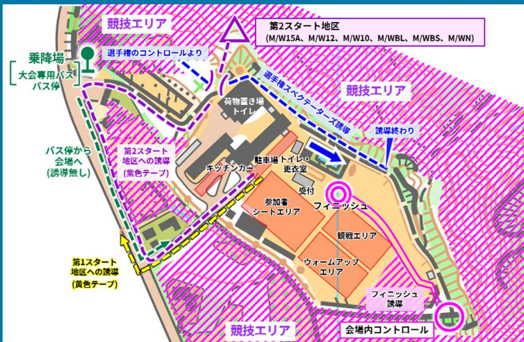
11/4(土) ミドル会場レイアウト