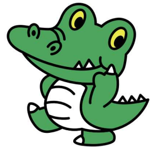
大阪大学公式マスコット「ワニ博士」