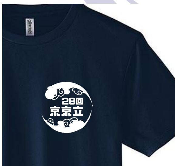
T シャツ表（左胸ロゴのみ）