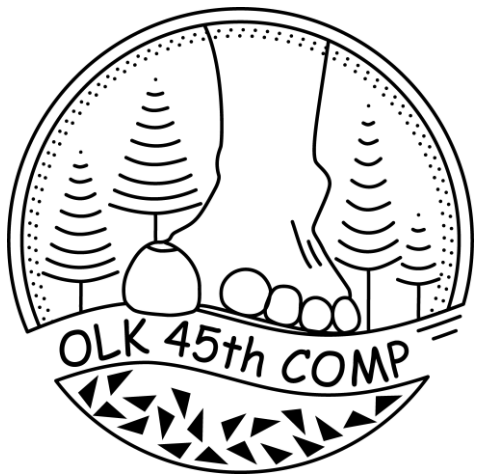
第 45 回東大 OLK 大会 T シャツロゴ

遠藤陽太 (Mail: endo-yota@g.ecc.u-tokyo.ac.jp )