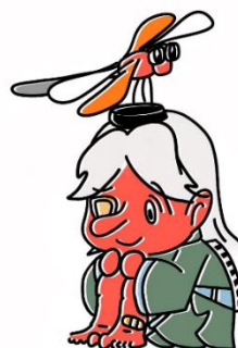
大会公式マスコット「こぶしお君」