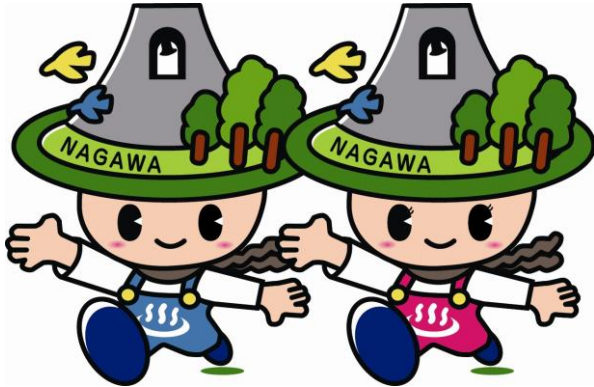
長和町イメージキャラクター・なっちゃん