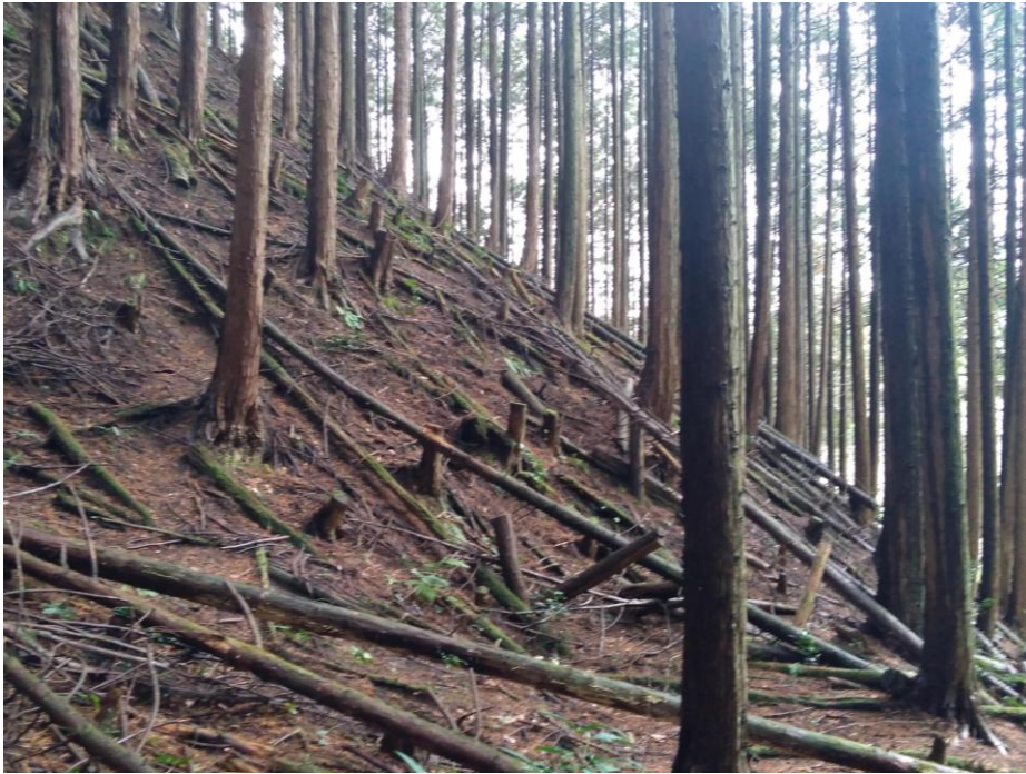
405 森 (走行可能度80-100%)