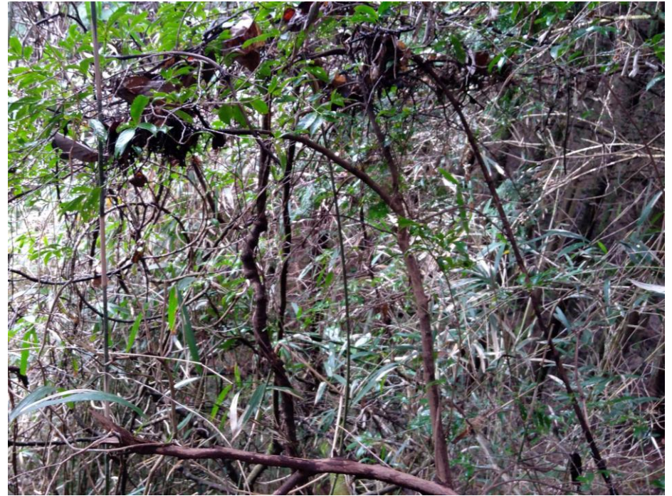
410 藪(通行困難) (走行可能度0-20%)