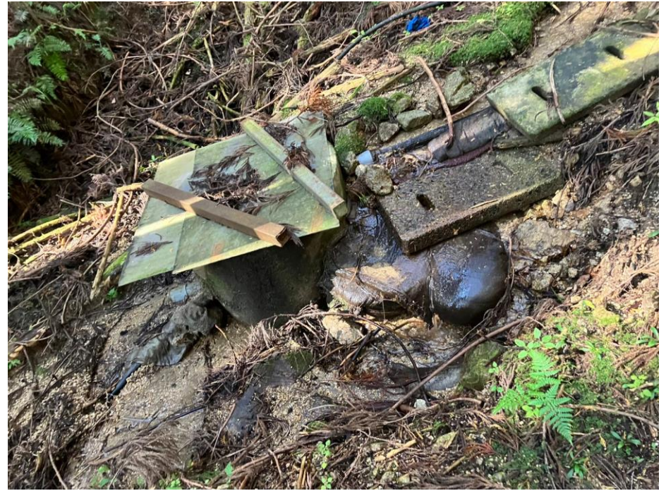
531 目立つ人工特徴物(×)