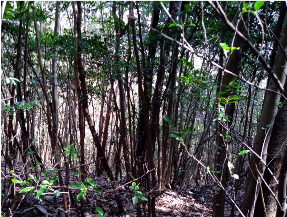
408 藪(走行困難) (走行可能度20-60%)