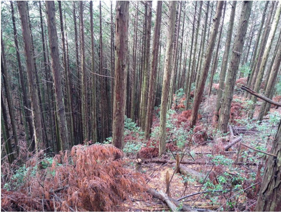
407 藪(速度低下、見通し良好) (走行可能度60-80%)