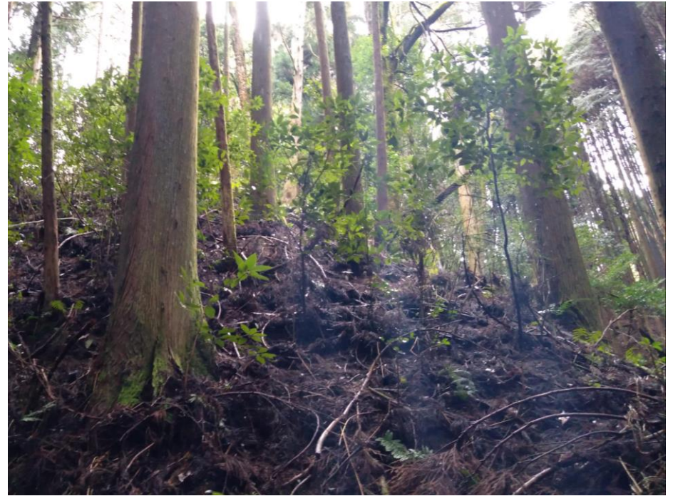
406 藪(速度低下) (走行可能度60-80%)