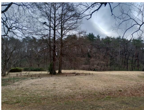
ふれあい広場(ヴィジュアル C 後)