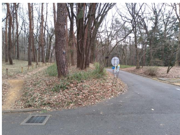
記念塔北東部の交差点(スタート後)