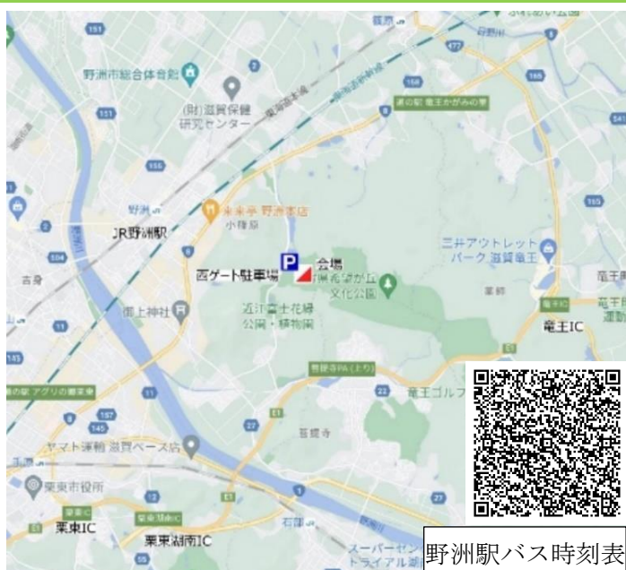
野洲駅バス時刻表

bus.jorudan.biz/diagrampoledtl?mode=1&fr=%E9%87%8E%E6%B4%B2%E9%A7%85%E3%80%94%E8%BF%91%E6%B1%9F%E9%89%84%E9%81%93%E3%83%BB%E6%B9%96%E5%9B%BD%E3%83%90%E3%82%B9%E3%80%95&frkbn=3&frsk=B&tosk=&dt=202302260000&dgmp1=%E9%87%8E%E6%B4%B2%E9%A7%85%E3%80%94%E8%BF%91%E6%B1%9F%E9%89%84%E9%81%93%E3%83%BB%E6%B9%96%E5%9B%BD%E3%83%90%E3%82%B9%E3%80%95%3A1%3A0&p=0%2C8%2C10