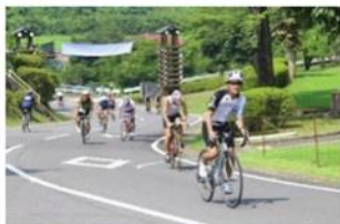
たかはらやまトライアスロン スイム、バイク、ランの3種目を連続で行う、己に打ち勝つ精神力が試されるレース。