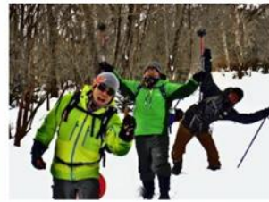
トレッキング&スノーシュー 四季を通じて様々な山遊びが楽しめる。