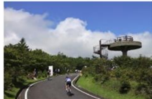
やいた八方ヶ原ヒルクライムレース 「栃木のラルブ・デュエズ」の異名をとる難関コースを駆け上がる。