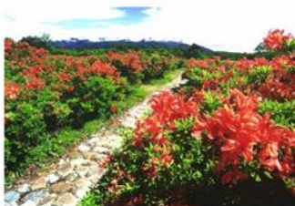
八方ヶ原 約20万株のレンゲツツジが咲き誇る、360度の絶景パノラマ。