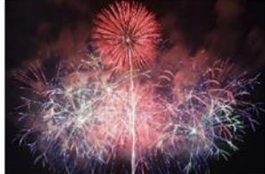
つつじの郷 やいた花火大会 尺玉やスターマインなど約10000発の花火が秋の夜空を華麗に、壮大に彩る。