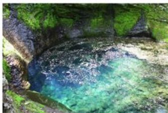
おしらじの滝 条件が整った時だけ神秘的なブルーの姿を見せる幻の滝。