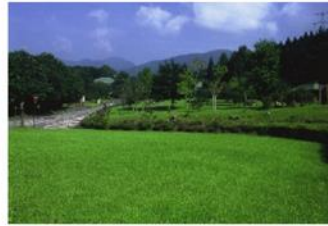
栃木県民の森 高原山の豊かな自然を知ることができる施設が充実。