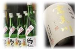
地酒 飲み飽きない旨口と、厚みと深みのある味わい。