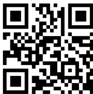
メール問い合わせ用 QR コード

大会ウェブサイト： https://omf.o-support.net メール： m-chako■ac.auone-net.jp（村越、■を@に変えてください） 電話： 070-4120-2353（小泉）