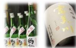
地酒 飲み飽きない旨口と、厚みと深みのある味わい。