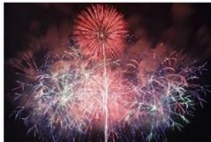
つつじの郷 やいた花火大会 尺玉やスターマインなど約10000発の花火が秋の夜空を華麗に、壮大に彩る。