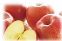
りんご 肥沃な土地と気候を生かした樹上完熟の蜜入りりんご。