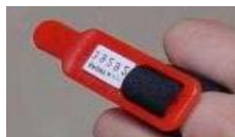
SIカード(差し込みパンチ)：使用できません