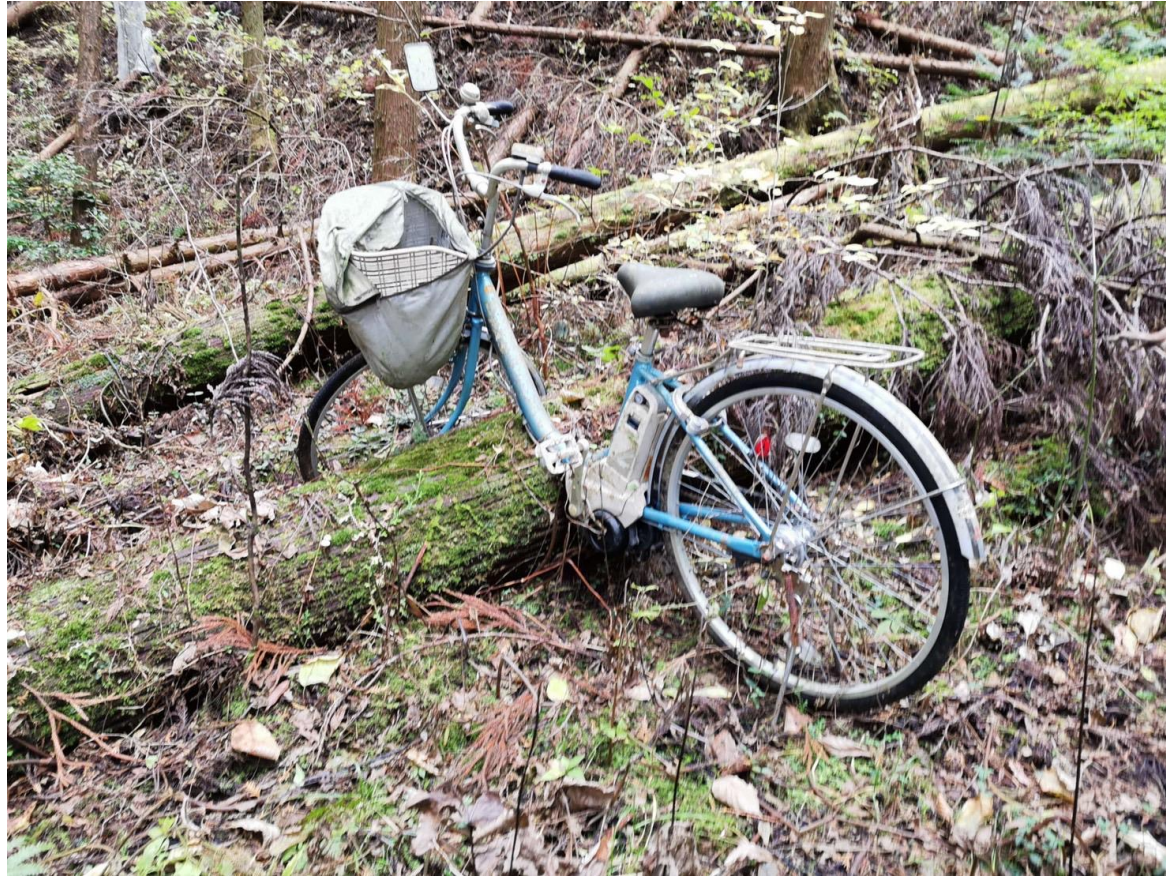
廃棄された自転車