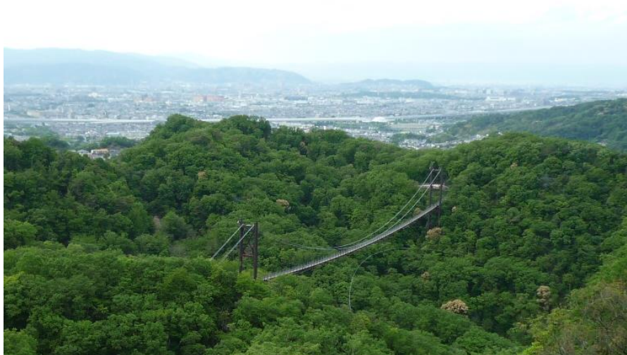
展望台から見る吊り橋「星のブランコ」

トレインの「府民の森ほしだ園地」は、昭和の終わりごろから整備が始まり、平成の時代に、遊歩道、展望台、吊り橋、クライミングウォールなどが次々とでき、今は多くの府民の憩いの場となっています。平成4年にOLCレオで地図を作って以来ずっと眠っていましたが、特にまつかぜの路、せせらぎの路、管理路などは、ゆるやかなトレイルが続き、気持ちよいトレイルランが楽しめます。展望台や吊り橋からの絶景も含めて。お楽しみください。