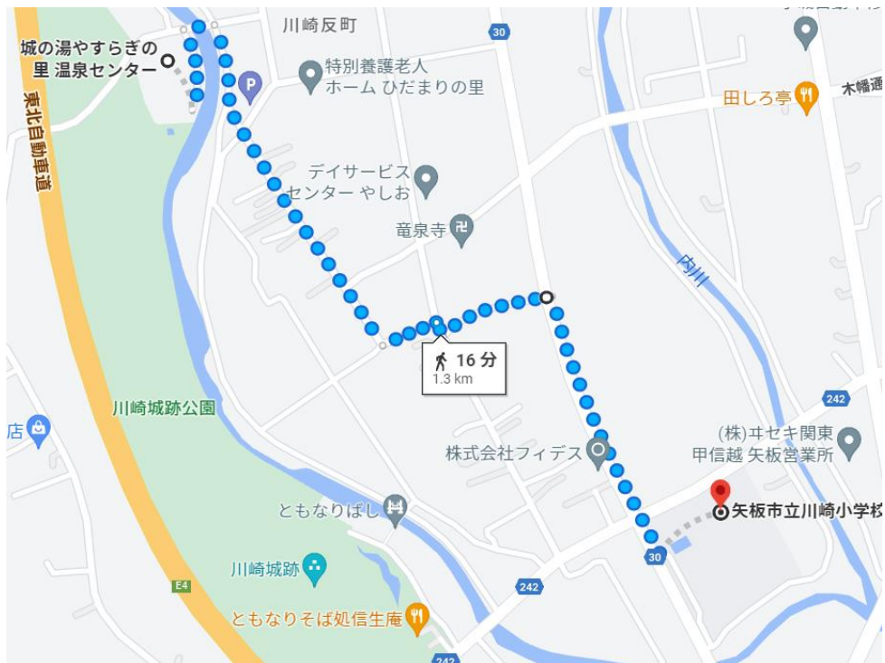
城の湯駐車場から矢板市立川崎小学校まで (Google マップより作成)