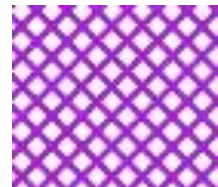
その他立ち入り禁止場所