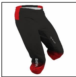
・トリム下 (S・M・L: ¥5,940)