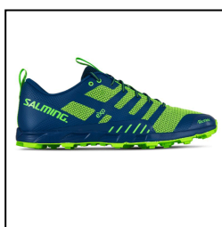
・オリエンテーリング山シューズ (サイズいろいろ ¥15,400~¥16,740)