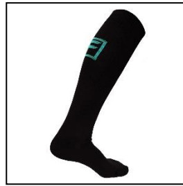
・長い靴下 (S・M・L: ¥2,530)