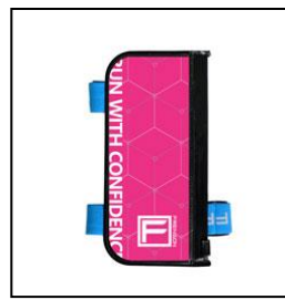
・デフケース (L: ¥1,650 S: ¥1,540)