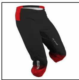
・トリム下 (S・M・L: ¥5,940)