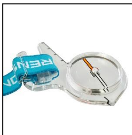
・サムコンパス (右・左) ¥7,480