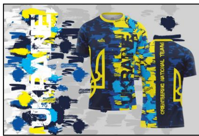
・トリム上 (サイズいろいろ ¥6,940~¥7,040)