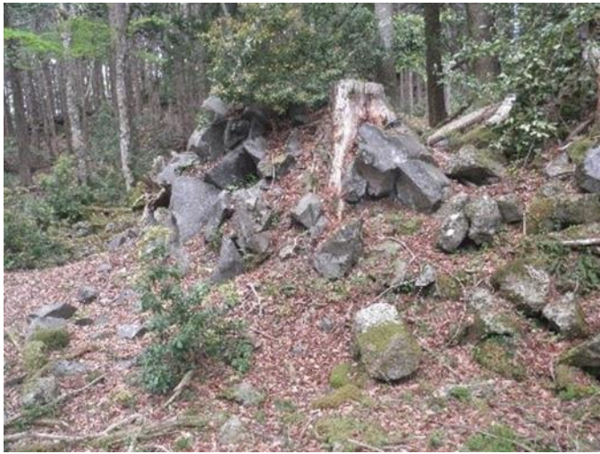
こぶ（土肌が見える）