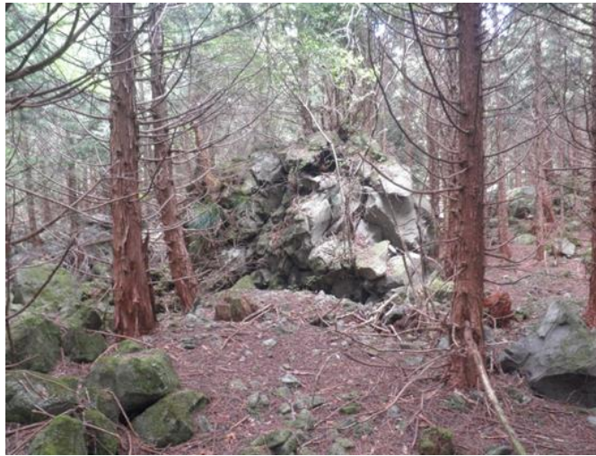
岩石群（全方向から見て岩が積み重なっている）