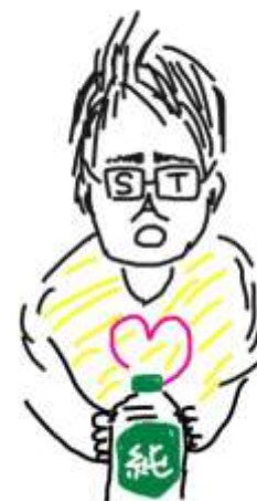
第6回留年練習会公式マスコット 「みどじゅん」