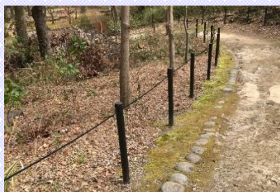
写真2 通行可能な柵