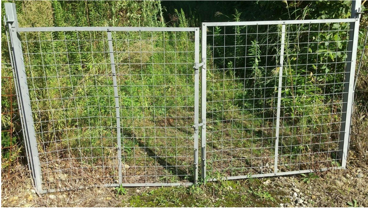
閉鎖されている扉