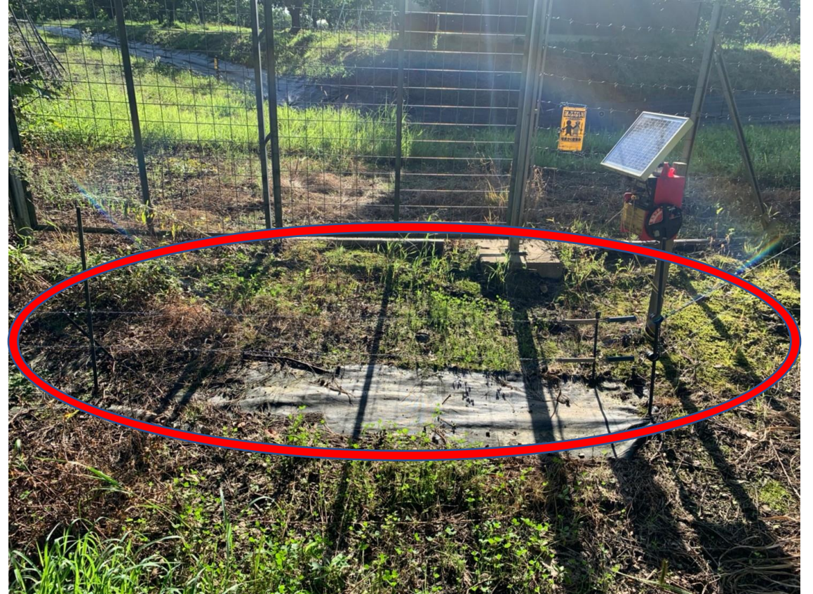
扉付近に見られる電気柵

通行者が多い部分には係員を配置しますので、指示があった場合はそれに従ってください。