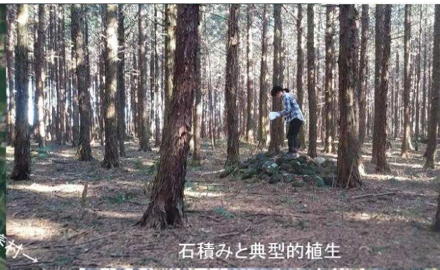
石積みと典型的植生