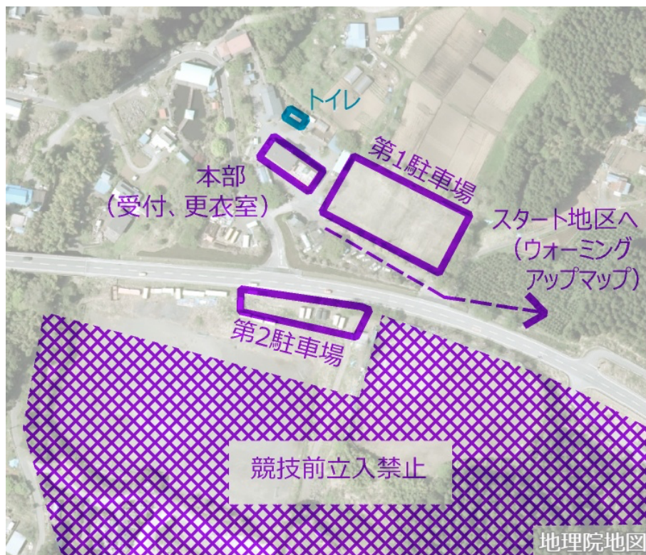
会場周辺図 (地理院地図より作成)