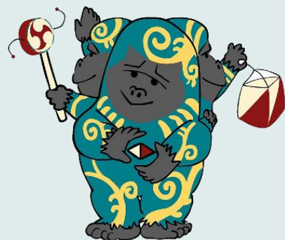
大会公式キャラクター ごりごりごり羅