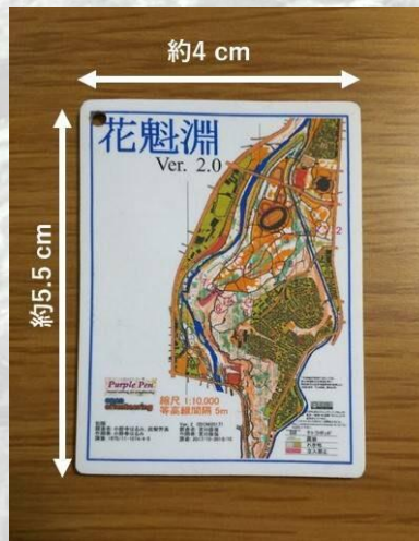
キーホルダー(イメージ図) ※本大会の地図で作成予定